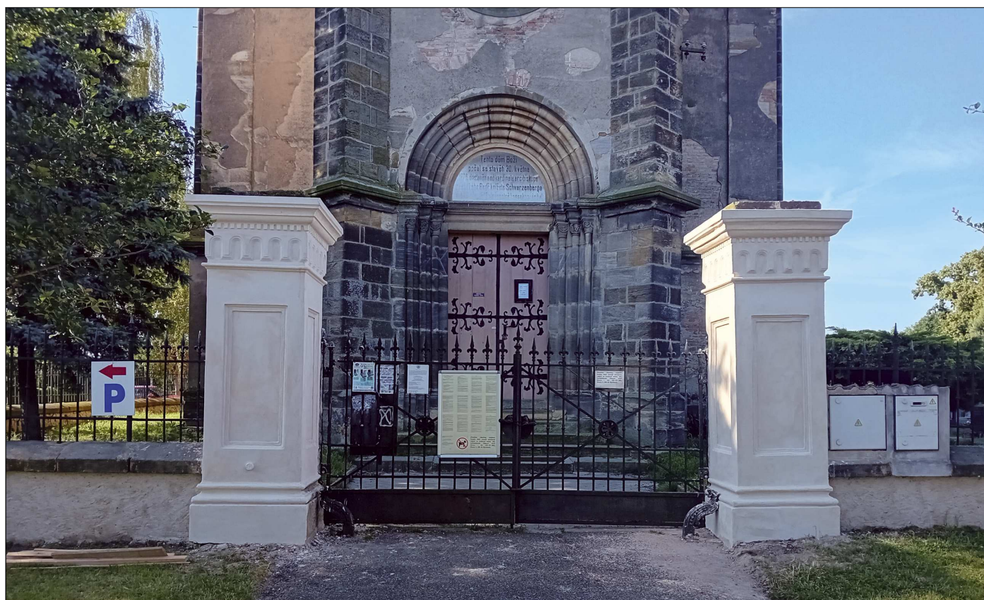
Současný stav v červnu roku 2024.