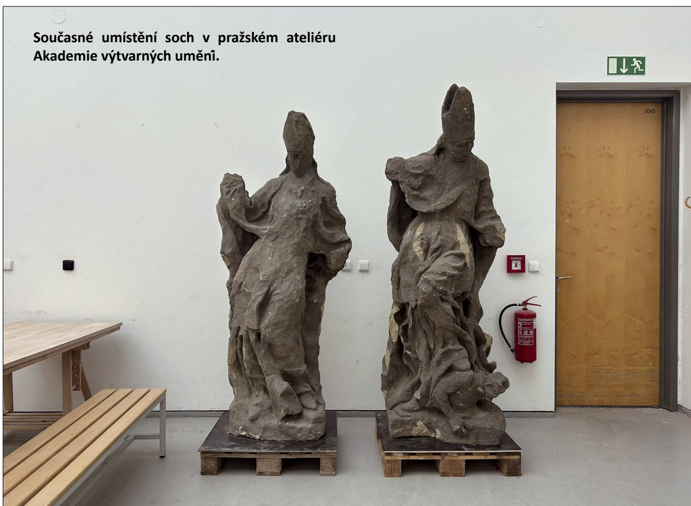
Současné umístění soch v pražském ateliéru Akademie výtvarných umění.