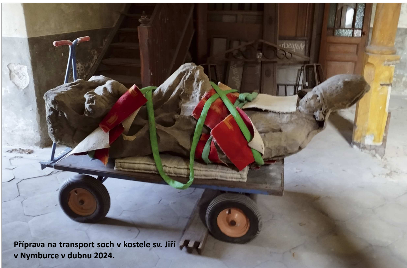
Příprava na transport soch v kostele sv. Jiří v Nymburce v dubnu 2024.