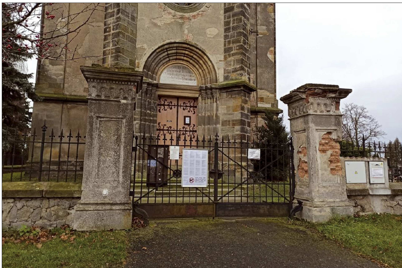
Původní stav pilířů před kostelem sv. Václava ve Velelibech v roce 2022.