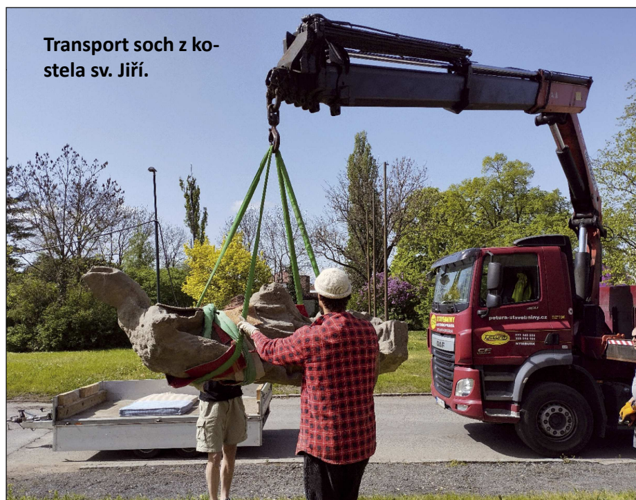
Transport soch z kostela sv. Jiří.

celou akci zapůjčila svůj jeřáb. Druhým neméně důležitým krokem je nedávno dokončená oprava pilířů vrat před hlavním vstupem do kostela (fotografie č. 5-7). Tuto opravu prováděla společnost Aurum Building s.r.o., která má zkušenosti mimo jiné i s restauracemi a opravami pro Národní památkový ústav ČR. Oprava sloupů u obou bran na velelibský hřbitov byla dokončena během tohoto léta, oprava a čištění zbývajících částí pískovcové podezdívky by pak měly být dokončeny do konce října. Na opravené pilíře střežící hlavní vstupní bránu kostela poté přijdou opětovně umístit již zmíněné kopie originálů soch z dílny Matyáše Brauna. Ty na přicházející návštěvníky kostela z tohoto místa zhlížely až do roku 1969, kdy byly sejmuty a uloženy v nymburském kostele sv. Jiří. Více informací a zají-