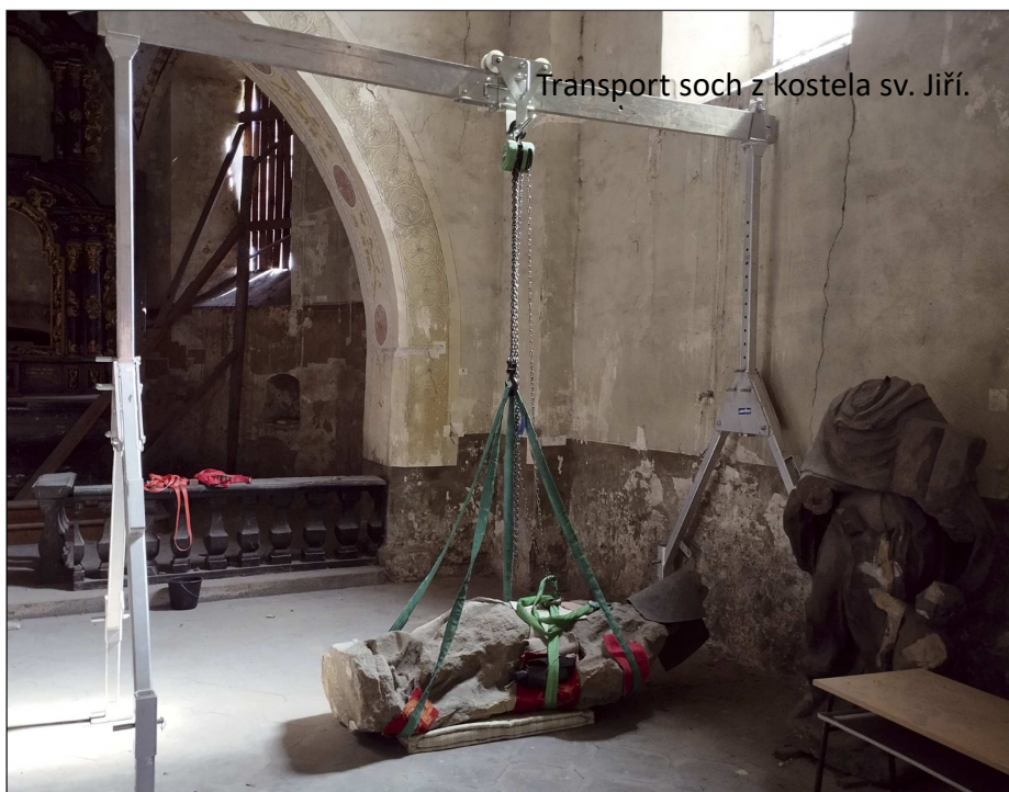
Transport soch z kostela sv. Jiří.

Prokopa z kostela sv. Jiří v Nymburce do Ateliéru restaurování výtvarných děl sochařských Akademie výtvarných umění (AVU) v Praze (fotografie č. 1-3). V tomto Ateliéru (fotografie č. 4) je pak od podzimu tohoto roku čeká náročná, avšak šetrná restaurace. Ta by měla být korunována vytvořením přesných kopií, které budou moci být umístěny na původní místo originálů před kostelem. O přesném umístění vzácných restaurovaných originálů z dílny Matyáše Brauna (1684-1738) se ještě jedná, jistotou však je, že budou umístěny na místě, kde nebudou nadále podléhat rozmarům počasí a povětrnostních podmínek. Transport soch proběhl ve spolupráci mezi studenty AVU, jejich vedoucím, akademickým sochařem a restaurátorem MgA. Janem Kracíkem a nymburskou stavební firmou Peťura, která na